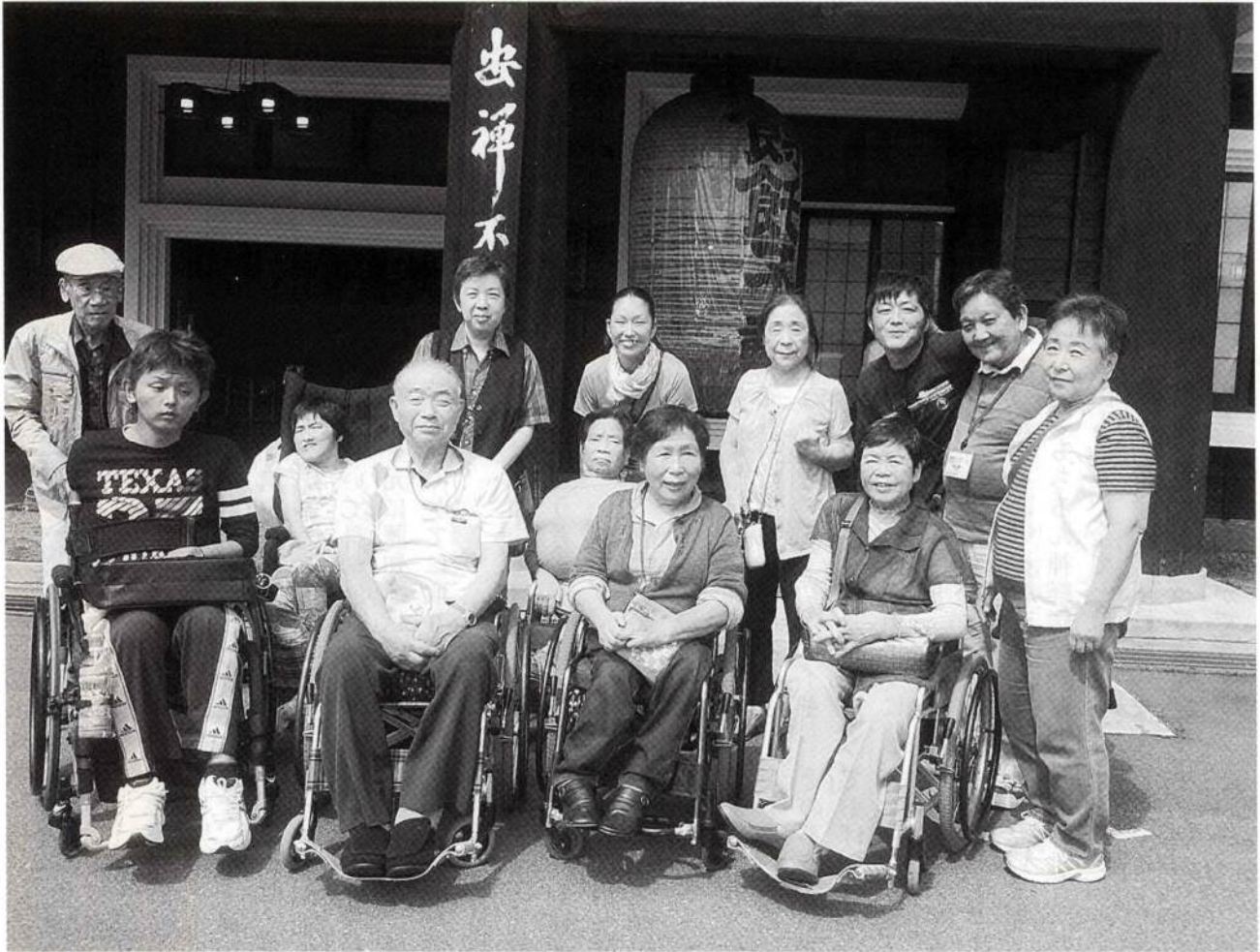
9月18日 くろっちょ外出。山梨へ葡萄狩りに。昼食は皆で『饂飩(ほうとう)』三昧。